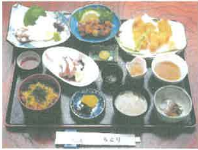
お食事処 ちどり たこフルコース