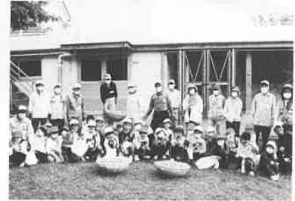
梅もぎ、梅漬け体験学習

高屋東小学校2年生児童の茶摘み体験学習の支援として、150年以上の歴史がある高屋東のお茶づくりをしました。3年ぶりの体験学習でした。晴天に恵まれ、柔らかそうな葉を選び準備してきた袋をいっぱいにすることが出来ました。児童達はいへん楽しそうに、お茶摘みをしていました。