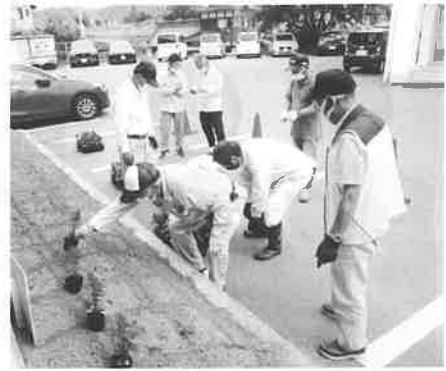
花壇にサルビアの苗を！

開催：令和4年6月13日（月） 場所：高屋東地域センター前 参加者数：7名 活動内容：環境美化活動 高屋東小学校校区住民自治協議会の環境美化活動に協力し、高屋東小学校体育館前の花壇にサルビアの苗約80本を植えました。