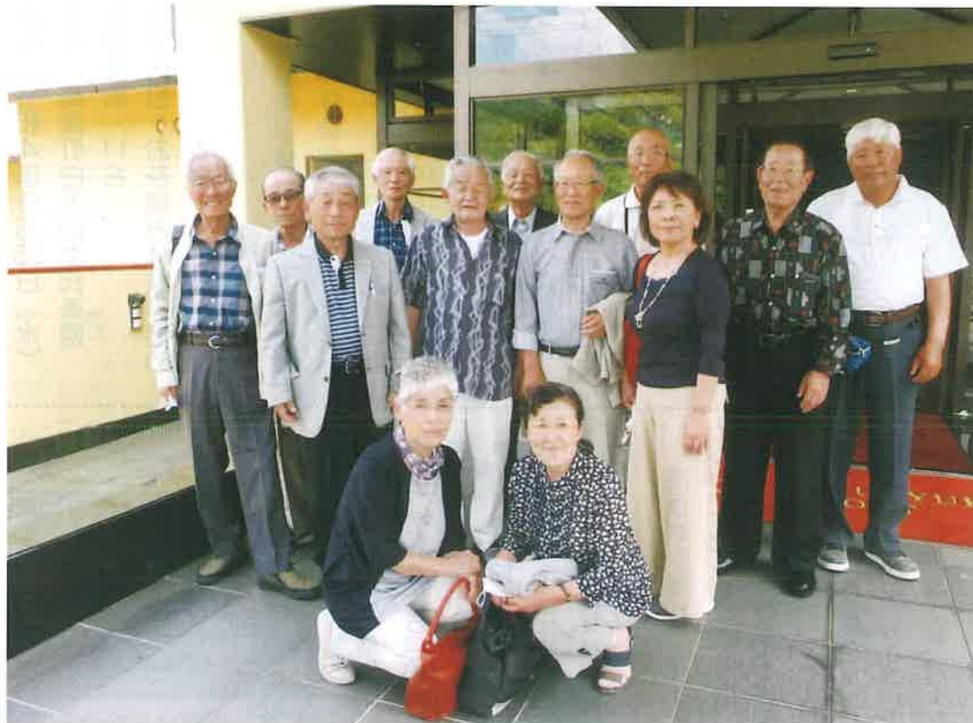
久しぶりの役員顔合わせ

と名前が一致せず、また数年間お世話をされ退任された旧役員の方々の労をねぎらうことも出来ない状況でしたが、今年6月コロナ感染予防に注意し白竜湖