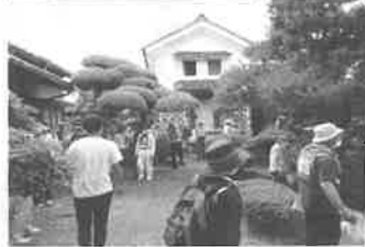
柄酒造 (創業 嘉永元年 (1848年) 代表銘柄 / 於多福・関西一