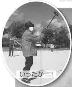
いいショットが出た! 大会結果