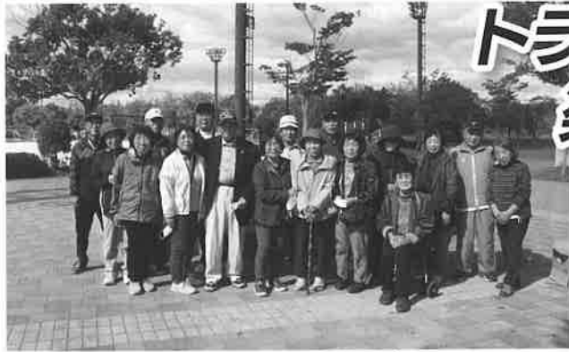
運営スタッフの皆さま