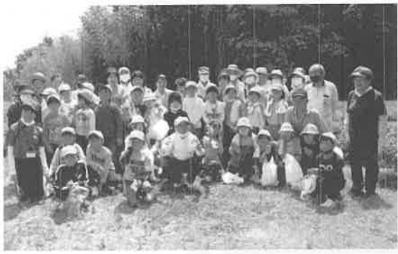
お茶摘み体験学習

開催：令和4年5月25日（水） 場所：高屋町白市山本氏茶園 参加者数：11名 活動内容：お茶摘み体験学習の支援