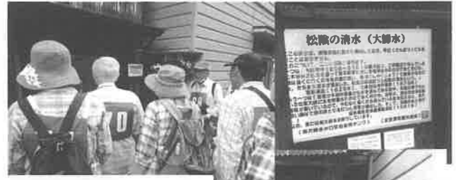
まつかげ 松陰の清水

伝教大師は水を飲ませてくれたお礼に、錫杖で石を打つたら、水が湧き出た。おかげで、干ばつでも水が枯れることはありません。