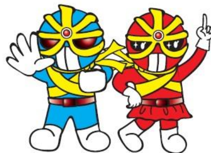
反射材活用促進キャラクター(広島県警)