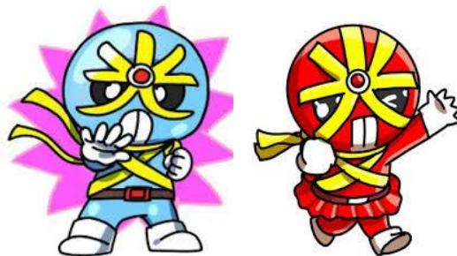
反射材活用促進キャラクター（広島県警）