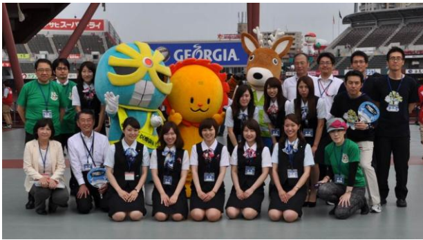
「キラリ☆マン」「みらいおん」「モンカ」と記念撮影!