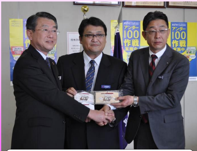
特殊詐欺被害防止に向けて、強力タッグ!

贈呈式では、セキスイハイムとほっかほっか亭の代表者から「絵馬を活用して、幅広い年代の皆さんに注意を呼びかけていただきたい」との言葉がありました。