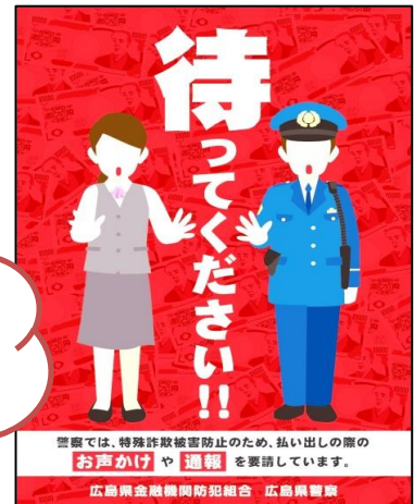
【コンビニ用声かけボード】